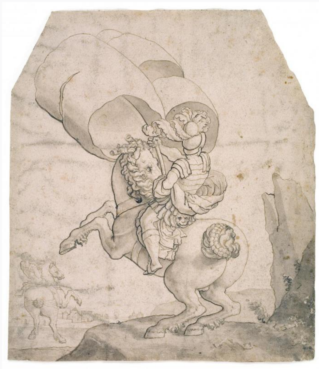
Fig. 6. Melchior Lorck: To ryttere, den forreste bærende en fane . 1553. Pen og blæk samt grålig lavering. 264 x 231 mm. Den kgl. Kobberstiksamling, KKSgb5460. Købt med J.C. Spenglers samling i 1840. Statens Museum for Kunst, public domain , SMK .

tilrejsende kunstnere som Heinrich Dittmers (1625-77), Jacob d'Agar (1642-1715) og Benoit le Coffre (1671-1722), 28 blade af Mandelberg, otte af J.P. Lund samt yderligere en snes blade af Spenglers gode ven, den tyskfødte Marcus Tuscher. [fig. 5] Men derudover var det, hvad tegninger angik, vanskeligt at tale om en dansk afdeling af den nystiftede institution. Værst stod det til med repræsentationen af tegninger fra perioden efter 1750, og det blev en af Thieles højeste prioriteter at råde bod på denne lakune.