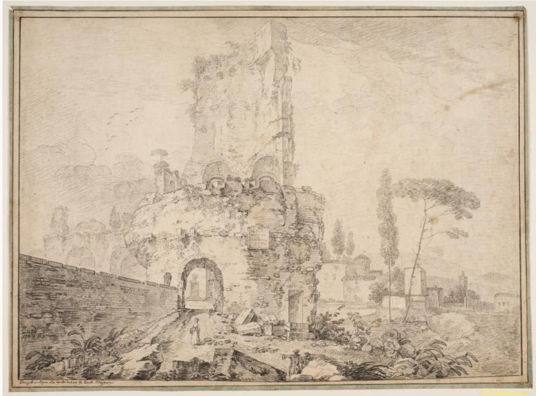
Fig. 4. J.P. Lund: Landskab med ruiner udenfor Rom . 1764. Blyant og sortkridt. 430 x 581 mm. Den kgl. Kobberstiksamling, KKSgb8698. Købt til Kunstakademiet på J.F. Clemens' auktion i 1832; overdraget til Den kgl. Kobberstiksamling i 1845.

dansk tegnekunst. Akademiet fortsatte derfor en tid med at indkøbe danske tegninger, og på kobberstikker J.F. Clemens' auktion den 1. maj 1832 indkøbtes således en gruppe gode tegninger af J.P. Lund, Abildgaard, Clemens, Juel og andre, 22 [fig. 3-4] Inden årtiets udgang var Kunstakademiet dog også på dette punkt blevet sejlet agterud.