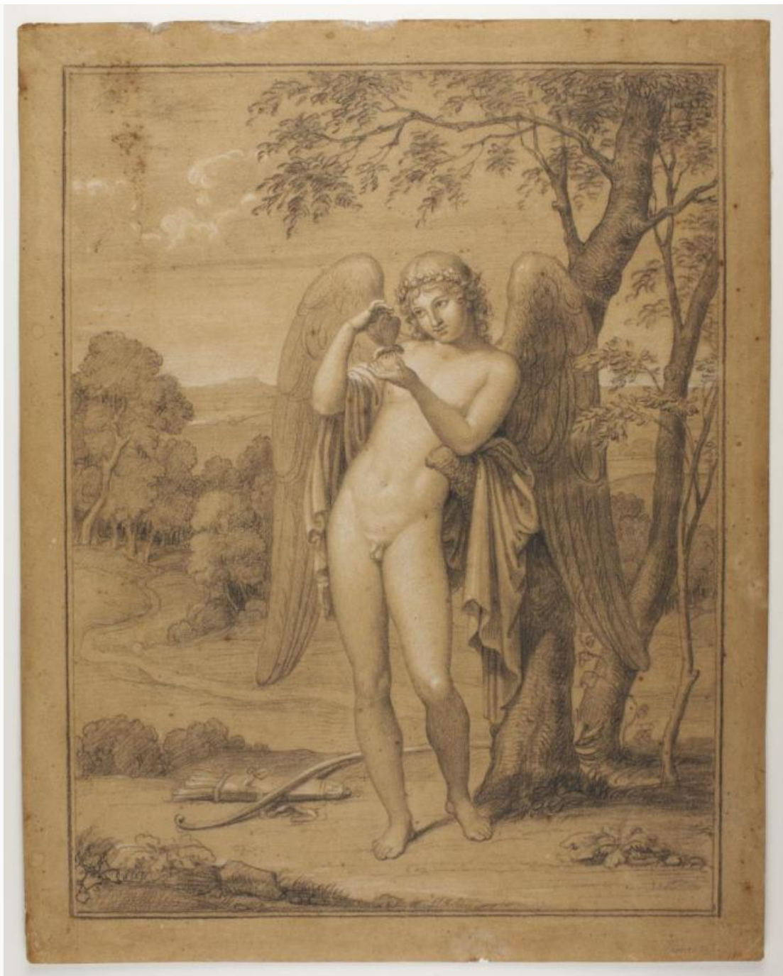
Fig. 13. Bertel Thorvaldsen: Amor leger med en sommerfugl . Ca. 1805-10. Sort kridt forhøjet med hvidt på lyst brunt papir. 421 x 333 mm. Den kgl. Kobberstiksamling, deponeret i Thorvaldsens Museum, Dep. 7. Købt af J.C. Spengler på Bülow's auktion i 1829 og indgået med Spenglers samling i 1840.

Mens Kunstakademiets tidlige tilløb til at skabe en offentlig samling af nationens tegnekunst altså snart forsvandt i glemslen, så havde Kobberstiksamlingen ved indgangen til 1840'erne fuldstændig overtaget rollen som hovedsamling af danske tegninger. Blandt kunstnere blev den tanke snart helt naturlig, at deres skitser og studier kunne være af national betydning og institutionel interesse. Så da Johan Thomas Lundbye forud for sin store udlandsrejse i 1845 gjorde sig tanker om sit jordiske gods, var det oplagt for ham at ønske: ”Tegningerne maatte ikke skilles ad, saafremt de kunde optages i en eller anden offentlig Samling.” 55