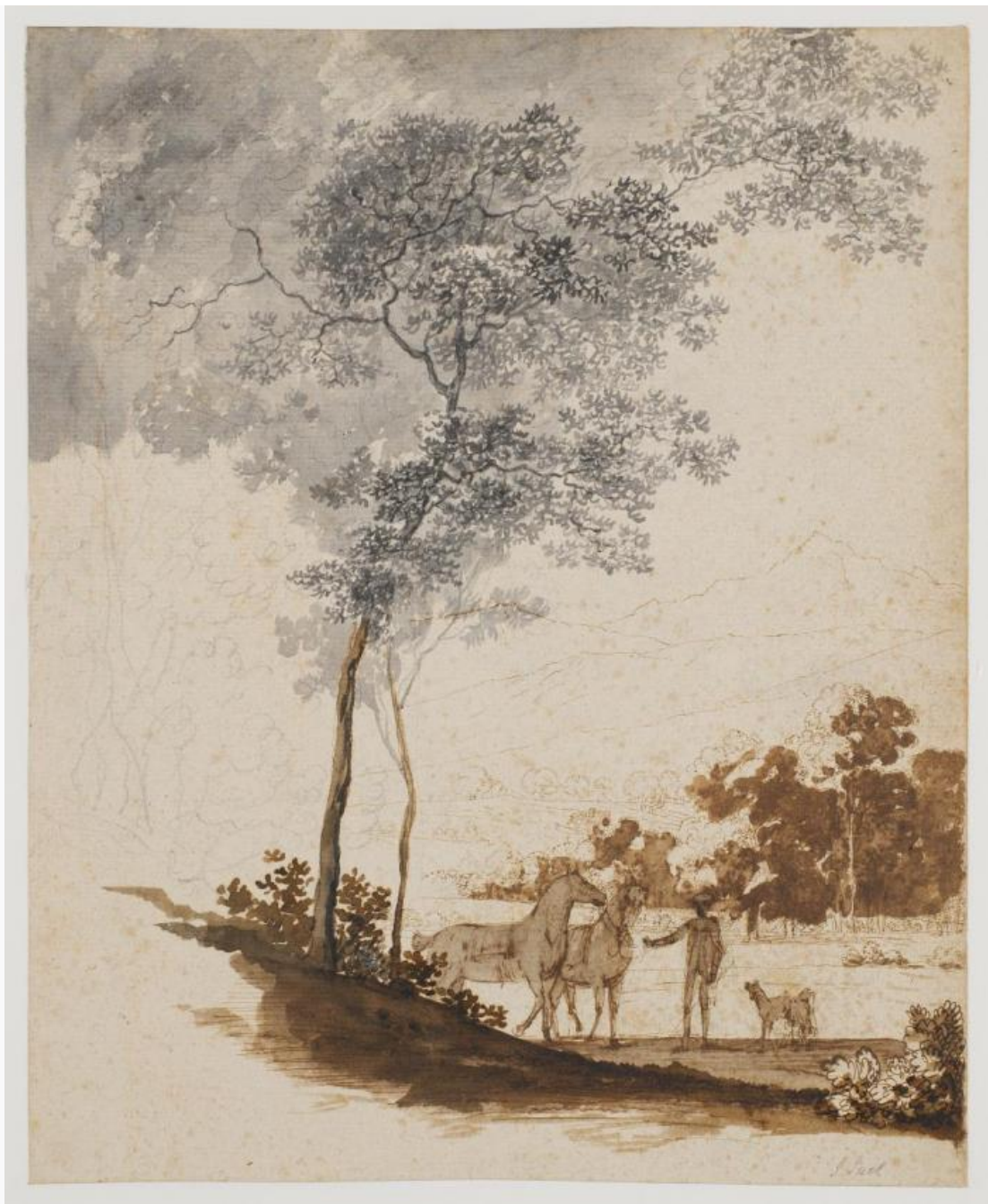
Fig. 9. Jens Juel: Schweizerlandskab med en rideknægt holdende to heste og et par hunde; studie til portræt af Jean-Armand Tronchin . Ca. 1779. Sortkridt, pen og blæk samt tuschlavering på grunderet papir. 347 x 285 mm. Den kgl. Kobberstiksamling, KKSgb5356. Købt med J.C. Spenglers samling i 1840. Statens Museum for Kunst, public domain . SMK .