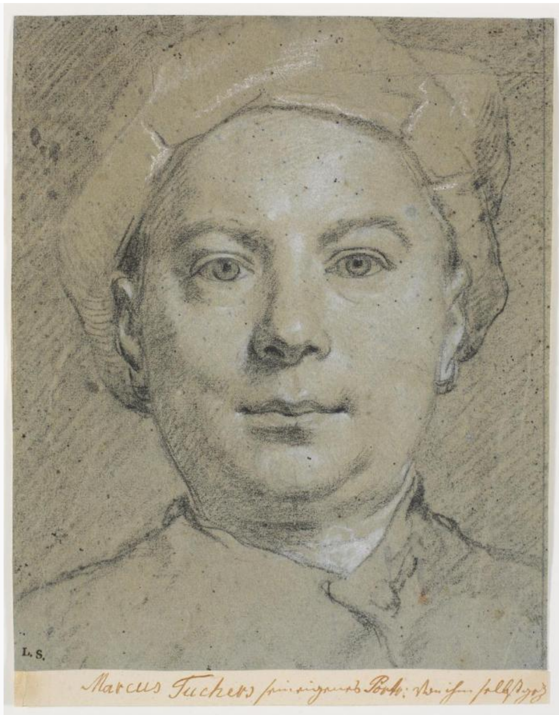
Fig. 5. Marcus Tuschet: Selvportræt . Ca. 1740'erne. Sort og hvidt kridt på grågrønligt papir. 266 x 216 mm. Den kgl. Kobberstiksamling, KKSgb6375. Købt af Frederik 6. med Lorenz Spenglers samling i 1810; indgået i Den kgl. Kobberstiksamling ved dens oprettelse i 1835. Statens Museum for Kunst, public domain , SMK .