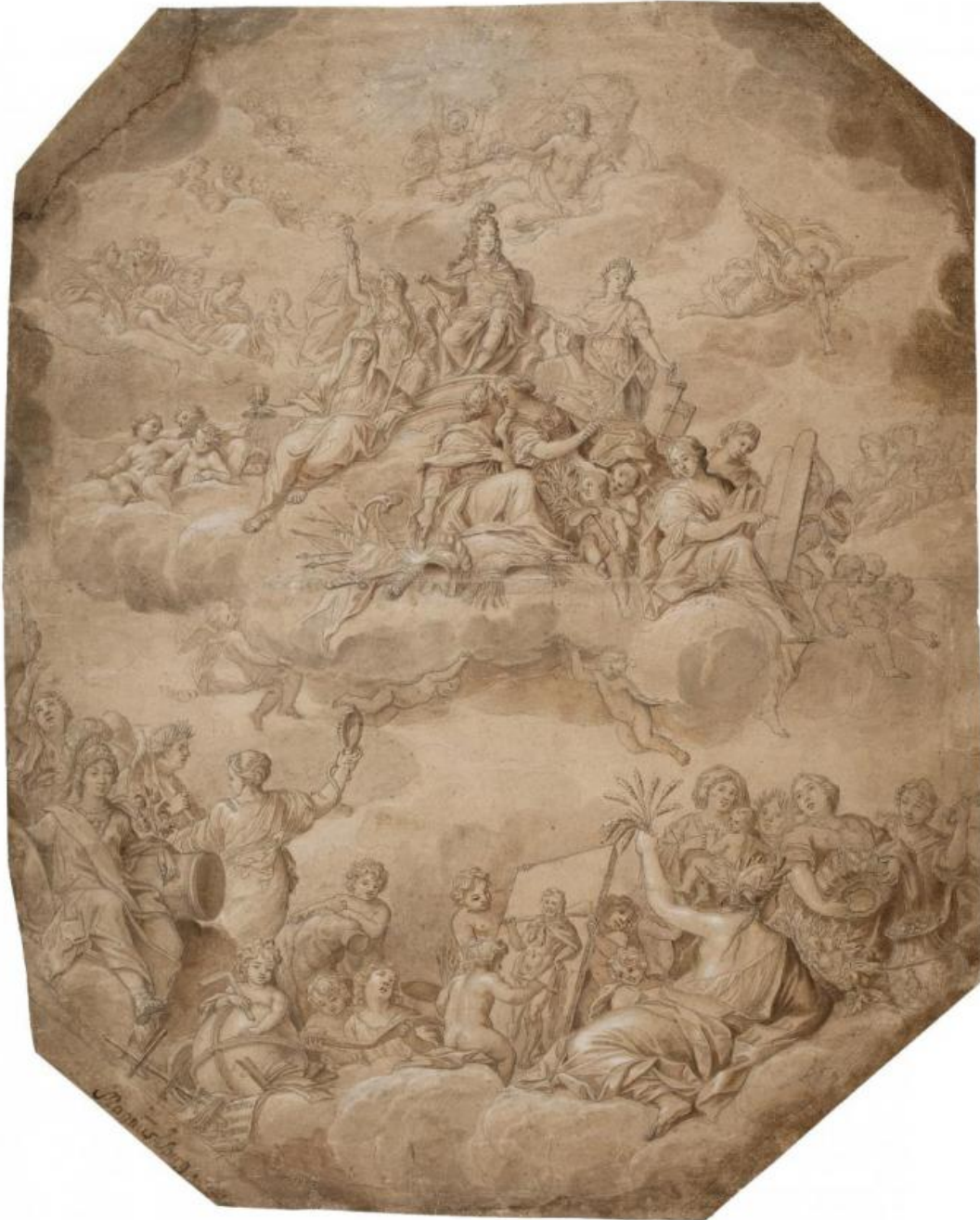
Fig. 7. Magnus Berg: Christian 5.'s apoteose . Pen og sort blæk, brun lavering, forhøjet med hvidt. 639 x 515 mm. Den kgl. Kobberstiksamling, KKSgb8759. Købt med J.C. Spenglers samling i 1840.

Spenglers danske samling omfattede mere end 1.700 blade og var anlagt som et historisk overblik over knap tre hundrede års tegnekunst, fra Melchior Lorck [bl.a. fig. 6] til C.W. Eckersberg. 26 Samlingen glimrer ikke alene ved sit omfang men også ved sin gennemgående høje kvalitet og ved det repræsentative udvalg af især 1700-tallets kunst. Særligt påfaldende var samlingens mange store blade som eksempelvis Jacob Conings parti af haven bag Charlottenborg, Magnus Bergs Christian 5.'s apoteose [fig. 7] eller Peder Als' smukke portrætstudier. 27 [fig. 8] Samlingen omfattede dog også mere uformelle og skitseagtige blade, hvoraf mange i samtiden ansås for at have begrænset kunstværdi. 28 Mindre kendte kunstnere og Spenglers yngre samtidige var som regel repræsenteret med nogle få blade, mens Spengler omvendt havde erhvervet