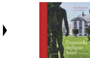
DANMARKS DEJLIGSTE HAVER. EN LYSTVANDRING

( http://www.historie-online.dk/boger/anmeldelser-5-5/kunst-arkitektur-haver-design-mode/danmarks-dejligste-haver-en-lystvandring )