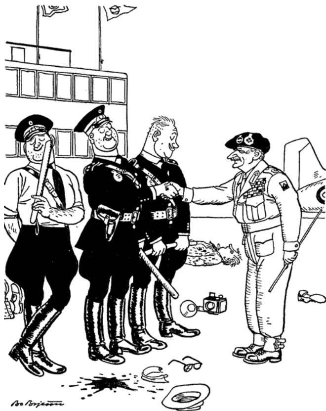
7/4 51: Der er gjort alt for at Montgomery kan faa et godt indtryk af den kampudfoldelse, han i givet fald kan regne med fra vor side.