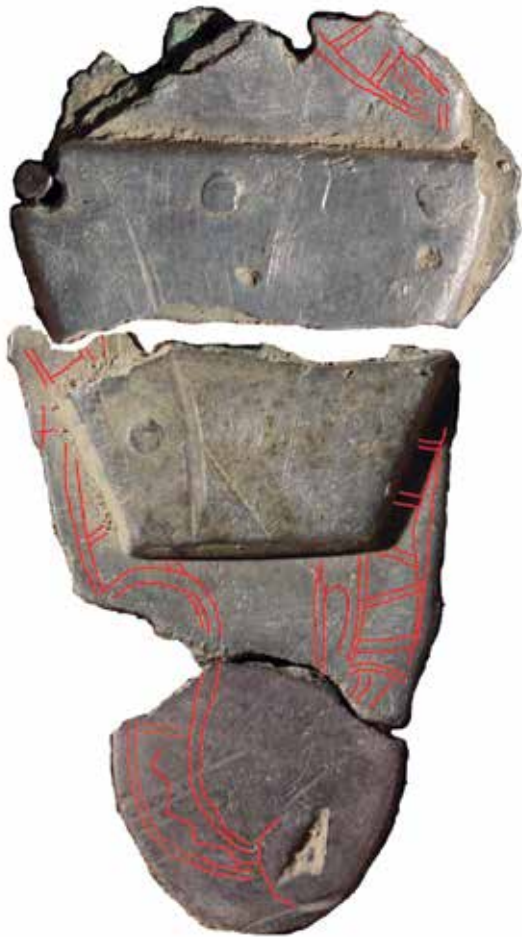
Fiblen fra Høvlbakke. Indridset ornamentik på bagsiden af fodpladen.

namentikken, hvilket står i modsætning til en anden ornamentik bag på fiblens fodplade, der blev "tegnet" med fri hånd. Den fortsætter ind under "sølv-lappen" og må således være ældre end reparationen. Motivet kan ikke ses i sin helhed, men forestiller øjensynlig et eller flere dyr set i profil i stort format. At ornamenterne ikke skulle ses kan skyldes, at de må have haft en anden, mere symbolsk funktion, måske som ondtafværgende foranstaltning. Fænomenet med "krypto-ornamentik" er