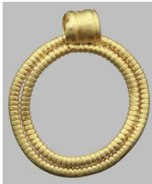
Guldvedhængt fra Høvlbakke. Vedhængt måler ca. 2 cm i diameter.

Smykker som dem fra Høvlbakke har ikke været båret af hvem som helst. De er lavet i så kostbare