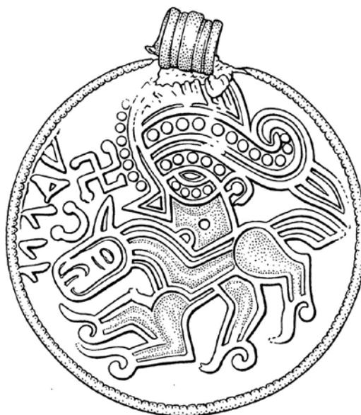
Foto t.v. Guldbrakteaten fra Høvlbakke. Brakteaten måler ca. 2,5 cm i diameter.