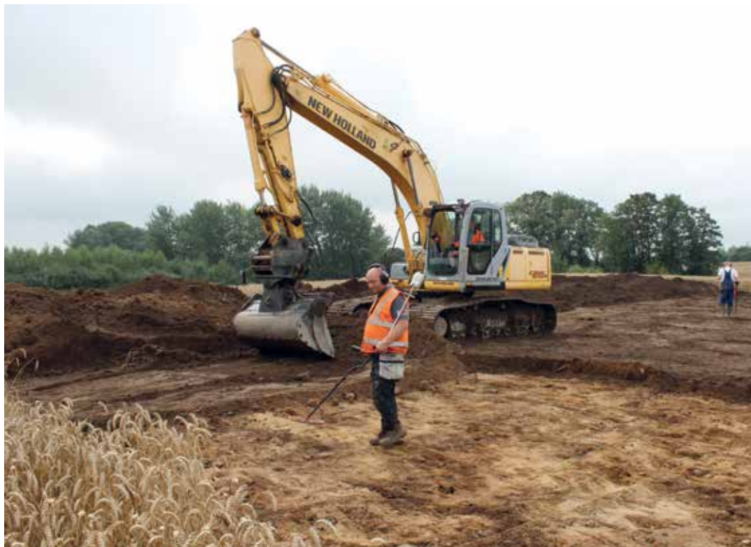
Fundstedet ved Høvlbakke under udgravning.

ret gravet ned, eller om der er stolpehuller fra træbyggede huse. Der var ingen spor af skattens nedlæggelsessted, endsige spor af huse. Derimod fandt vi en stump mere af den fornemme fibel, der af tidens (og plovens) tand var slået i adskillige stykker.