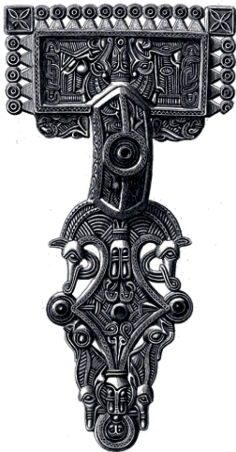
Relieffibel fra Hove Mølle. Kobberstik af Magnus Petersen.