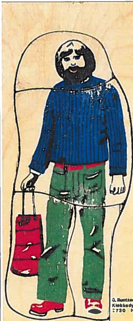
Q. Børnsten K. 730 No

En børnehavestue fra Brønby Strand, komplet med børnemøbler, bongotrommer og 1970'ernes ideellefiske brændeovn, er flyttet ind på Nationalmuseet, der zoomer ind på børnelivet som en del af vores velfærdshistorie.