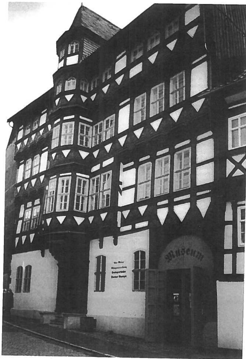
Museet Alte Münze i Stolberg. Bygningen blev bygget og indrettet til møntsted i 1535.

en Steen: Münztechnologische Verbin- schen Dänemark, Preussen und Sach- lahren 1577 bis 1585, i Radziminski, Andecki, Janusz (red.): Prusy-Polska- dia z dziejów sredniowiecza i czasów t, (Torun, 1999), s. 131-141.