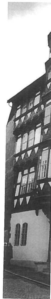
Museet Alte Münze i Stolberg