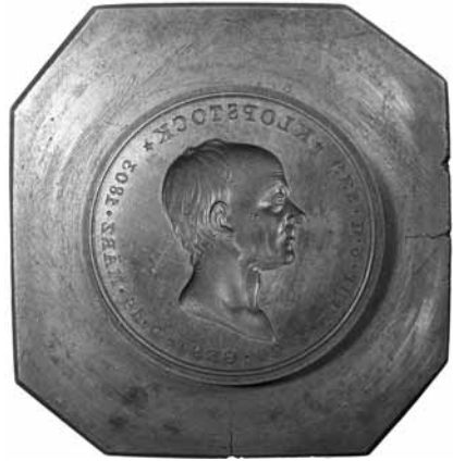
Fig. 8: Forsidestemplet. Bemærk revner. Cirka 1.746 gram. Højde inklusiv og eksklusiv forhøjningen med graveringen cirka 58 og cirka 54 mm. Forhøjningens diameter cirka 43 mm. Stemplets korpus er cirka 66x68 mm.