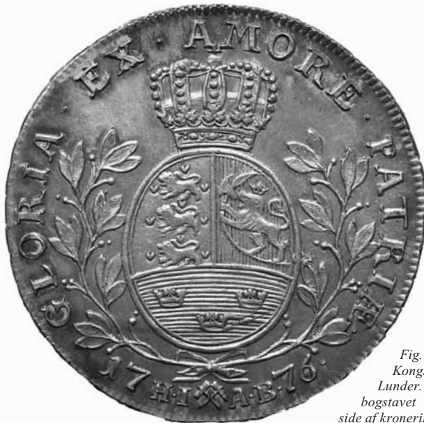
Fig. 3. Bagside af en specie præget i Kongsberg med stempel skåret af Lunder. Karakteristika: Særegen form på bogstavet G. Trekant-figurer yderst i hver side af kroneringene. Diameter: 41 mm.