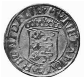
Fig. 8. 1 mark, 1535, Roskilde