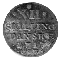
Fig. 2. 12 skilling 1717 med tre roser, 4,14 gram, Hede 43B. Bagside. Nationalmuseet, Den kgl. Mønt- og Medaillesamling, Hovedsamlingen. GP 678.

trakt var forpligtet til. Sølvet var i perioden stærkt efterspurgt, da forpagteren af Mønten i Glückstadt og kommende forpagter af Mønten i Rendsborg, Michael Joseph, skulle bruge sølv til sine udmøntninger. Rentekammeret var derfor imødekommende, da Fürst og Goldschmidt i 1716 ansøgte om lov til den nævnte udmøntning på Mønten i København. Den slags ansøgninger var ikke ualmindelige i datidens møntvæsen. I 16-1800-tallet gik langt de fleste ansøgninger dog på møntstederne i hertugdømmerne, mens de sjældnere var rettet mod Mønten i København. At sagen var usædvanlig, kan også være med til at forklare ændringen i motivet.