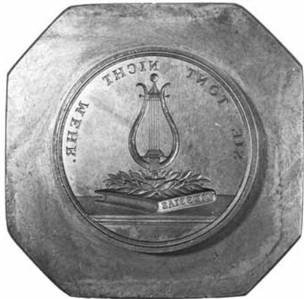
Fig. 9: Bagsidestemplet med musen. Bemærk slidtågen, det vil sige den begyndende sammentrykning/sammensynkning af stemplet. Cirka 1.324 gram. Højde inklusiv og eksklusiv forhøjningen med graveringen cirka 58 og cirka 52 mm. Forhøjningens diameter cirka 42 mm. Stemplets korpus er målt ved den ene ende cirka 60x59 mm.