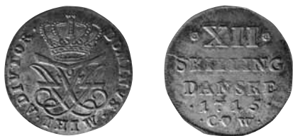
Fig. 1. 12 skilling 1715, 3,73 gram, Hede 43B. Der var samme type forside på 12 skillingerne 1712-19. Nationalmuseet, Den kgl. Mønt- og Medaillesamling, Hovedsamlingen.