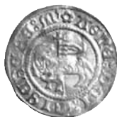
Fig. 12. Skilling, 1536, Visby