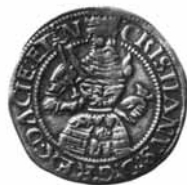
Fig. 5. 2 skilling, 1536, Århus