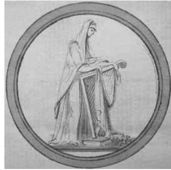
Fig. 6: De indsendte tegninger. Begge cirka 43,5 mm. Rigsarkivet.