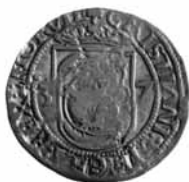
Fig. 11. Skilling, 1537, Bergen.