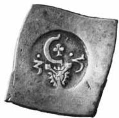
Fig. 3. Ensidig klipping, 1535, Århus