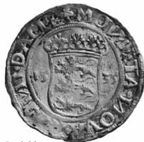
Fig. 7. 2 mark, 1535, Roskilde