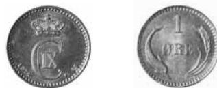
1 øre 1874