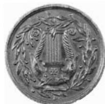
Fig. 3: Medalje for 100-års dagen for F.G. Klopstocks fødsel i Quedlinburg, stempler formentlig graveret af G.V. Bauert. Tin/tinlegering?, cirka 27 mm, 7,67 gram. Motivet har lyre og laurbærkrands til fælles med fig. 1-2. Indskrift: KLOPSTOCK'S SÆCULAR=FEIER IN QUEDLINBURG. AM II JULIUS MDCCCXXIII. Nationalmuseet, Den kgl. Mønt- og Medaillesamling.