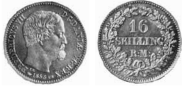
16 skilling 1856

Vi skolebørn skulle gerne i frikvarteret have bud over til sagfører Bay for at få vekslet vore snavsede skillinger med de blanke kobbermønter, hvoraf særligt de store blanke femører vakte beundring. Og mangen velhaver blandt os fik vekslet et markstykke med 33 blanke enører, disse blev opbevaret i bukselommen, hvorfra de foreløbig blev taget op, ikke for at blive givet ud, men for at blive taget i øjesyn af en beundrende skare“.