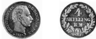
4 skilling 1867