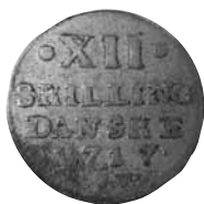
Fig. 6: 12 skilling 1717 med to roser, 3,42 gram, Hede 43B. Nationalmuseet, Den kgl. Mønt- og Medaillesamling, Hovedsamlingen, GP 982. 34

Imidlertid er det med ovenstående forklaring i baghovedet vanskeligt at forklare fremgangsmåden ved en lille udmøntning, der blev foretaget ved månedsskiftet mellem september og oktober 1718 – altså efter ophøret af Fürst og Goldschmidts udmøntning. Der blev af sølv fra det kongelige Sølvkammer udmøntet 1.000 rigsdaler i 12 skillinger, og i regnskabsmaterialet fremgår det utvetydigt, at “de blev præget med et Stempel... 1718 med