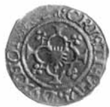
Fig. 2. 1/2 skilling lybsk, 1534, Slesvig