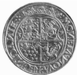
Fig. 9. Daler, 1537, København.