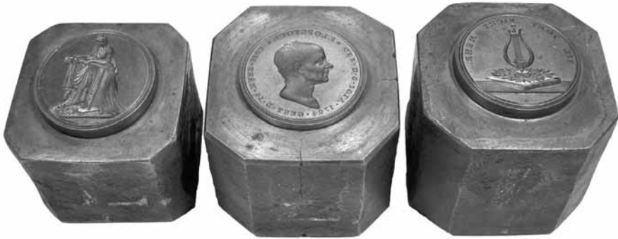
Fig. 7: De tre bevarede stempler. Nationalmuseet, Den kgl. Mønt- og Medaillesamling.

mærksomme på, at der af begge medalje kan være foretaget prægninger i flere forskellige omgange – eventuelt med adskillige års mellemrum.