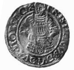
Fig. 1. 2 skilling lybsk, 1534, Slesvig