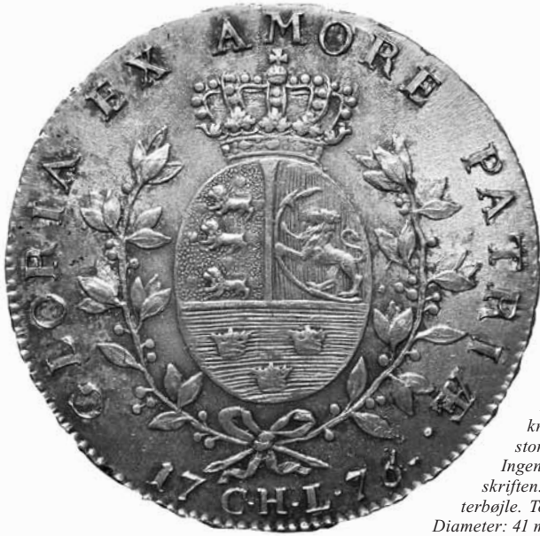
Fig. 2. Bagside af en specie præget i Altona med stempel skåret af Wolff. Karakteristika: Enkeltstående blade i den nedre del af de to grene. 18-20 blade pr. gren. Grene krydser ikke hinanden. Relativ stor sløjfe forbinder de to grene. Ingen punkter mellem ordene i omskriften. To perler i kronernes midterbøjle. To ruderfigurer i kroneringene. Diameter: 41 mm.