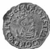
Fig. 6. 1 skilling, 1536, Ribe.