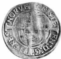
Fig. 10. Skilling 1535 Oslo.