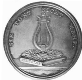
Fig. 2: Mindemedalje for F.G. Klopstock, stempler graveret af G.V. Bauert. Sølv, 42,5 mm, 29,21 gram. Bagsidemotivet er: "En Fodlyra, staaende i en Laurbærkrands, der ligger paa en Bog, paa hvis Ryg: Messias". 28 Indskrift: SIE TÖNT NICHT MEHR. Nationalmuseet, Den kgl. Mønt- og Medaillesamling.