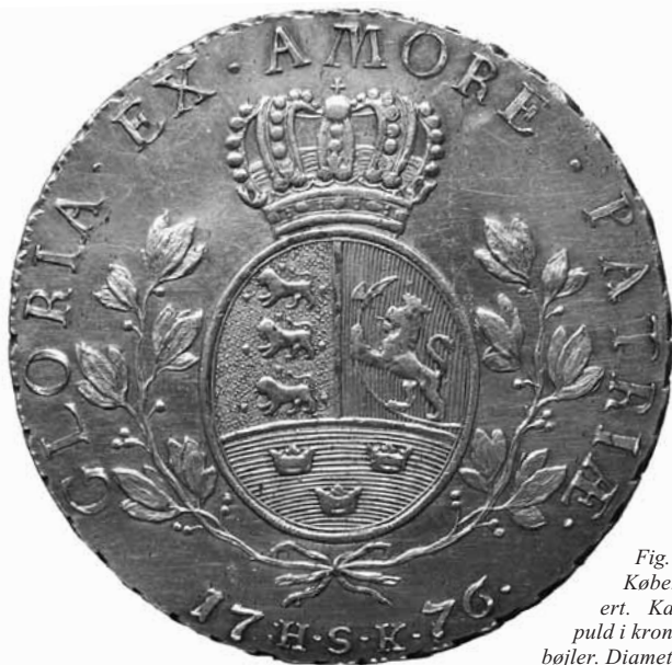
Fig. 1. Bagside af en specie præget i København med stempel skåret af Bauert. Karakteristika: Vandret skraveret puld i kronen. Bløde kurver i kronernes ydre bøjler. Diameter: 41 mm.

Man bemærker, at i det ovale våbenskjold adskilles det nederste felt fra de to øverste med en lige linje på Wolffs stempler og på en buet linje på Bauerts og Lunders stempler. Denne forskel går igen på eksemplarer af andre typer (Hede 7-12, 27-29, 31, Norge 2-3, 14-15) og må siges at være et særkende for Wolffs produktion (upubl. undersøgelse af Frank Pedersen).