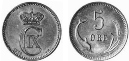
5 øre 1874