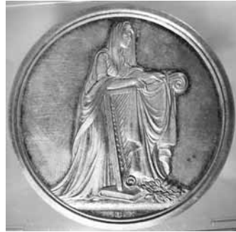
Fig. 1: Mindemedalje for F.G. Klopstock, stempler graveret af G.V. Bauert. Fremstillet på Mønten i Altona. Sølv, 42 mm, 29,12 gram. Bagsidemotivet er "Den sørgende Muse tildækker Digterens Harpe, der staaer paa en Bog (Messias) [Klopstocks kendteste værk]; foran denne en Laurbærkrands." 26 Nationalmuseet, Den kgl. Mønt- og Medaillesamling. 27