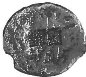
Senmiddelalderlig sølvbarre i Det nedersaksiske Møntkabinet. Se side 19 og 22