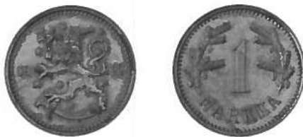
Fig. 1. Pligtafleveringseksemplar af finsk 1 mark 1922. 24 mm. Kobbernikkel. Produceret på Mønten i København i første halvår af 1922 i 10.000.006 eksemplarer. De sidste seks stykker var blandt andet to pligtafleveringseksemplarer, som i slutningen af januar 1922 blev indsendt til Den kgl. Mønt- og Medaillesamling, Nationalmuseet. De sidste fire stykker blev sendt til Finansministeriet og den danske konge. Den kgl. Mønt- og Medaillesamling, Nationalmuseet. GP 1709.

Pligtafleveringen gjaldt også ikke-nationale mønter og medaljer. Således blev der også fra Mønten i Altona (1771-1863) indsendt pligt-