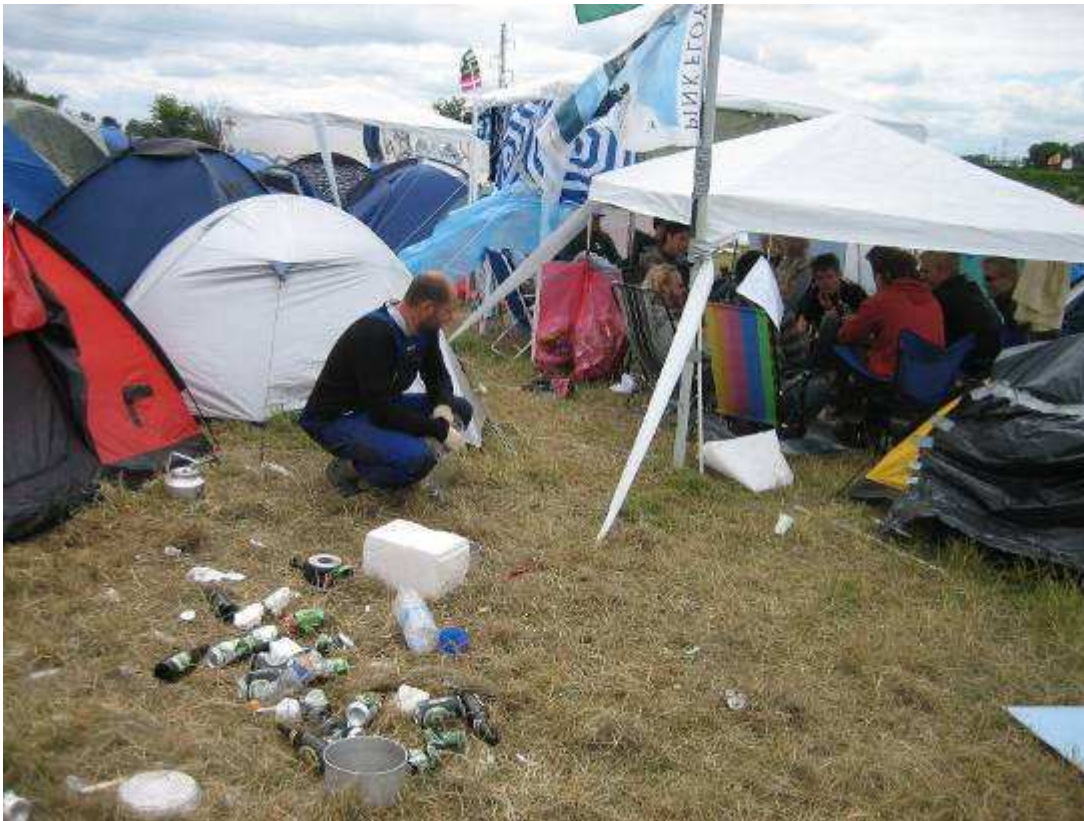
Figur 3: Eksempel på forskellig affaldshåndtering. Billedet er taget, hvor den svenske lejr (intet affald) støder op til en lejr med danske unge (affald).

Der var markante forskelle mellem de danske lejre og den svenske lejr. Mængden af affald var påfaldende lille i den svenske lejr, samtidig med at affaldet blev sorteret i hhv. dåser, glasflasker og andet affald. I de danske lejre var mængden affald generelt større, samtidig med at alt undtagen ølflasker med pant røg ud i samme affaldsbunke/pose. Dette kan tolkes på baggrund af de forskellige traditioner for affaldshåndtering der findes i Danmark og Sverige. Sverige har en temmelig udbygget affaldssortering, som slet ikke findes tilsvarende i Danmark, og som kan forklare den næsten "rituelle" håndtering af affald i den svenske lejr (se fig.3). Denne adfærd kommer til at indvirke på det arkæologiske materiale og kan også aflæses herudfra.