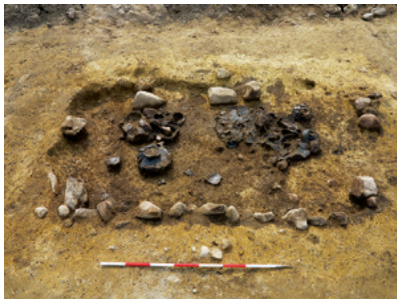
Bunden af grav A2662 er nået. Her ses de mange knuste lerkar.

tæt på. Der var altså al mulig grund til, at vi var temmelig spændte, da graveskeerne blev stukket på graven.