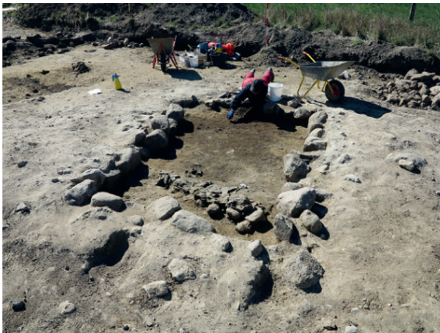
Grav A2661 under udgravning. Gravens eneste fund – de fem lerkar – ligger knust i forgrunden.

Graven var plyndret! Der kan ikke være andre forklaringer på de manglende sten i toppen af graven og den komplette mangel på gravgaver i samme ende. Det er meget vanskeligt at vurdere, om plyndringen er sket i samtiden eller senere. De mange fine gravgaver, der er fremdraget af sløjfede høje ved Stjær i slutningen af 1800-tallet i forbindelse med landbrug, dateres til at være samtidig med den udgravede bebyg-