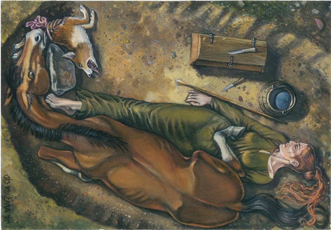
Rekonstruktion af Grydehøj A505