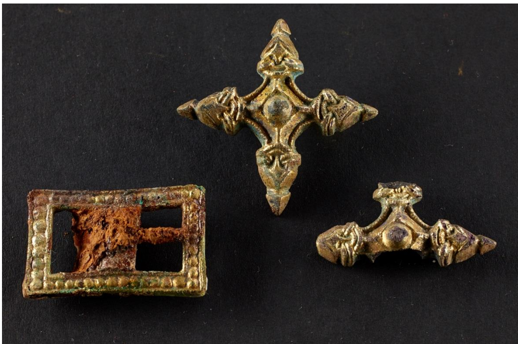
Figur 3. Her ses to af de i alt syv korsformede selesamlere og et ud af de i alt fire rektangulære spænder. De afbildede genstande er alle fundet i forundersøgelsen.