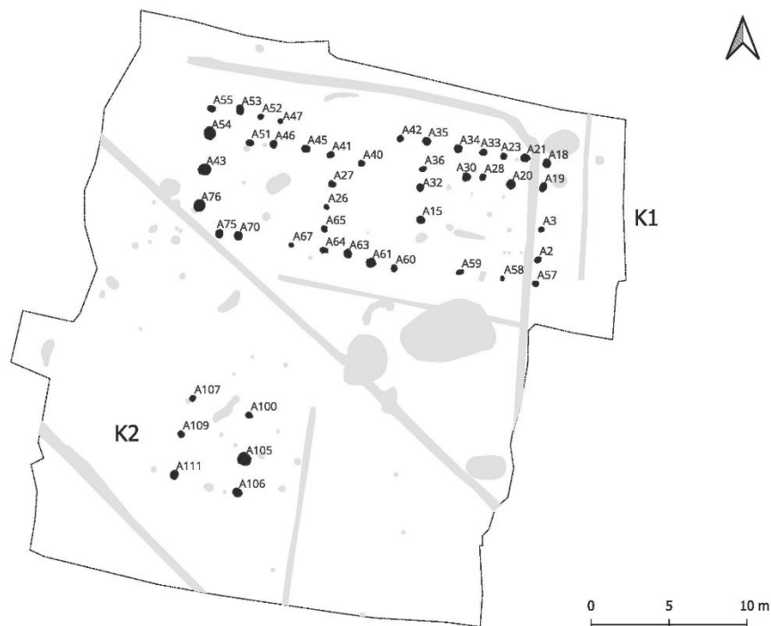
Figur 1: K1 og K2

Den relativt store mængde af havre i A63 kan repræsentere en enkeltstående begivenhed, hvor en portion havre er forkullet ved et uheld eller at der er tale om en brandtomt, hvor korn, primært i form af havre har været opbevaret i midterrummet.