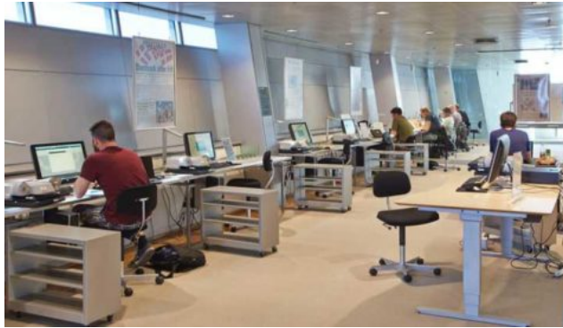
Det Kgl. Biblioteks læsesal med mikrofilmsfremvisning