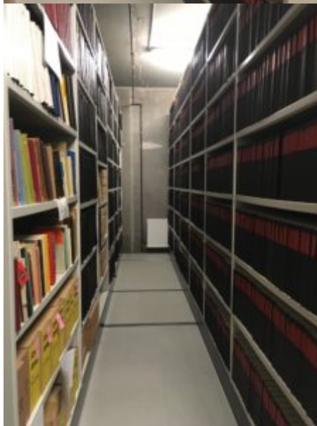
DR arkivs reoler med de mange sendelister